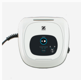
Unidad de control