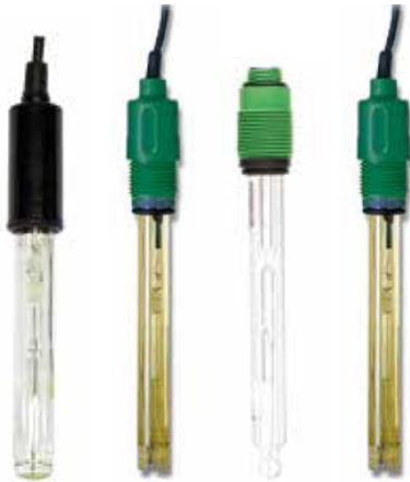
HI1286DGB HI2114P HI1090T HI3214P