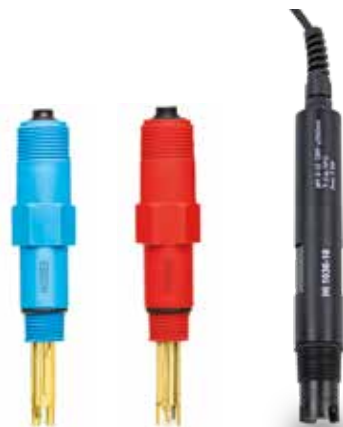
HI10053 HI20083 HI1036-1802